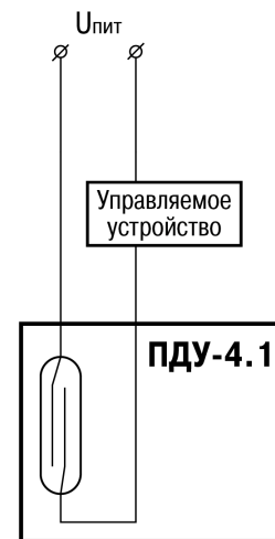
Рисунок 4.2 – Подключение датчика